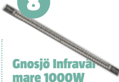
Gnosjö Infravärmare 1000W

150 kronor 1 000 Watt 99x7 cm 1,8 kg IP21 1,4 meter Traditionell infra