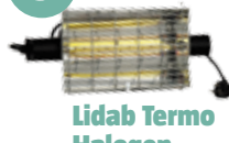
Lidab Termo Halogen